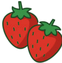
Fraise et fraise des bois